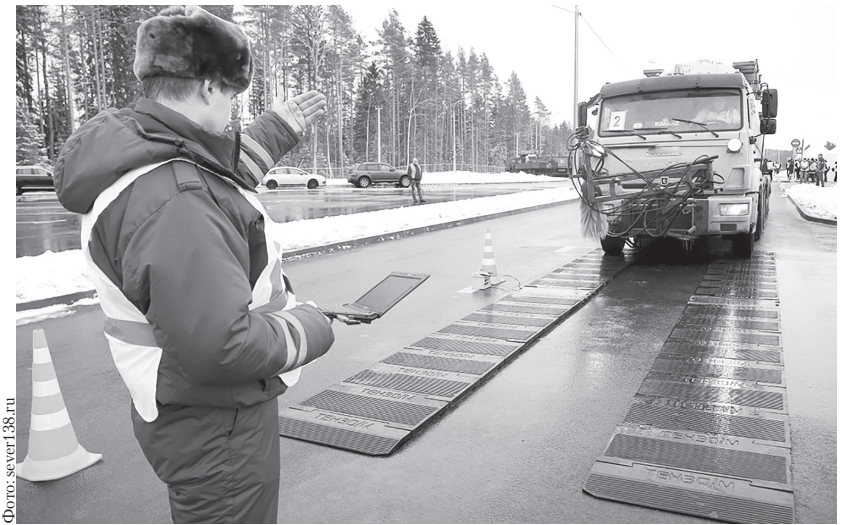
В топ-3 проблем ульяновских предпринимателей в 2022 году вошли вопросы об осуществлении автоматического весового и габаритного контроля на дорогах регионального значения.

Ульяновский региональный центр компетенций в сфере произ-